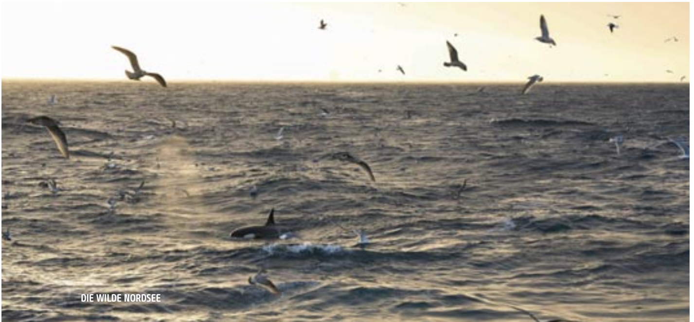
DIE WILDE NORDSEE