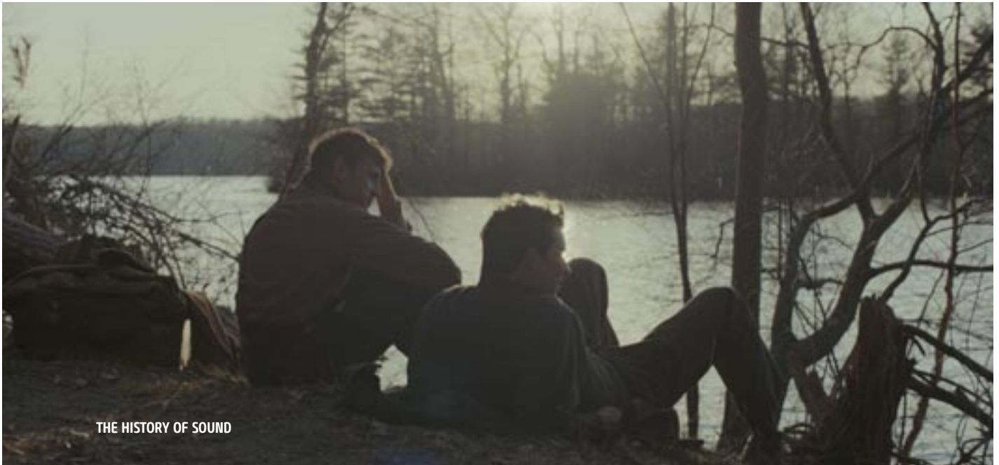
THE HISTORY OF SOUND