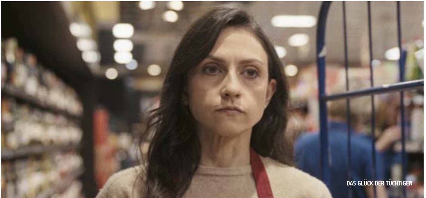
DAS GLÜCK DER TÜCHTIGEN