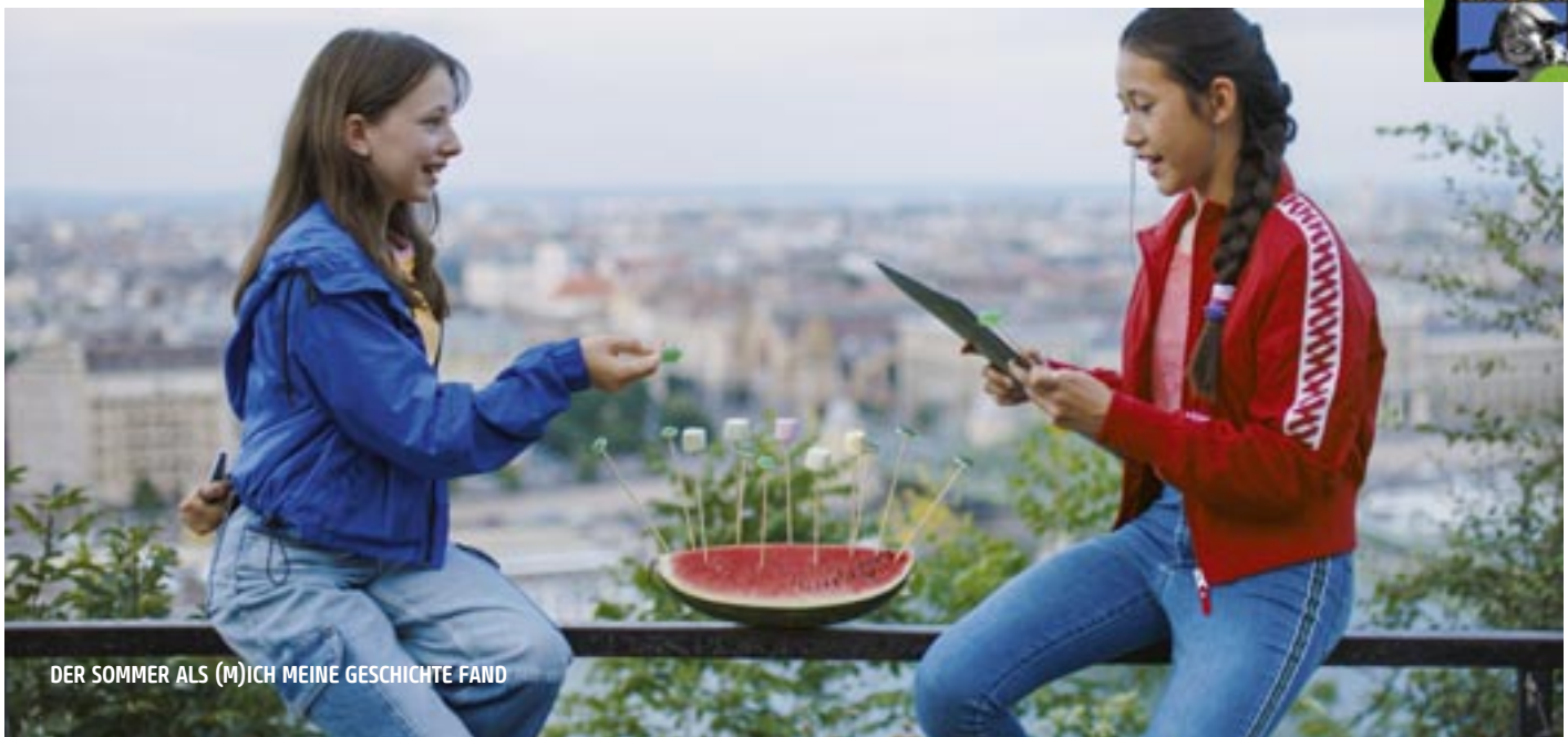
DER SOMMER ALS (M)ICH MEINE GESCHICHTE FAND