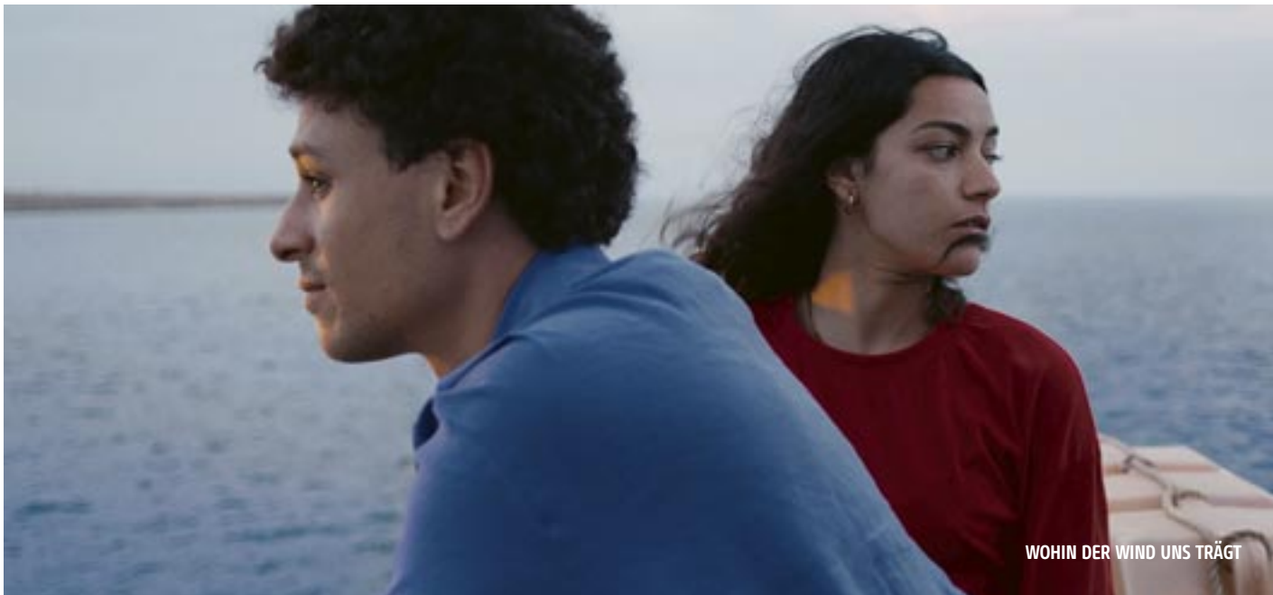
WOHIN DER WIND UNS TRÄGT