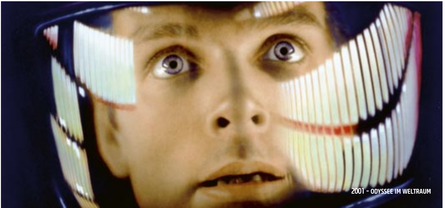
2001 - ODYSSEE IM WELTRAUM