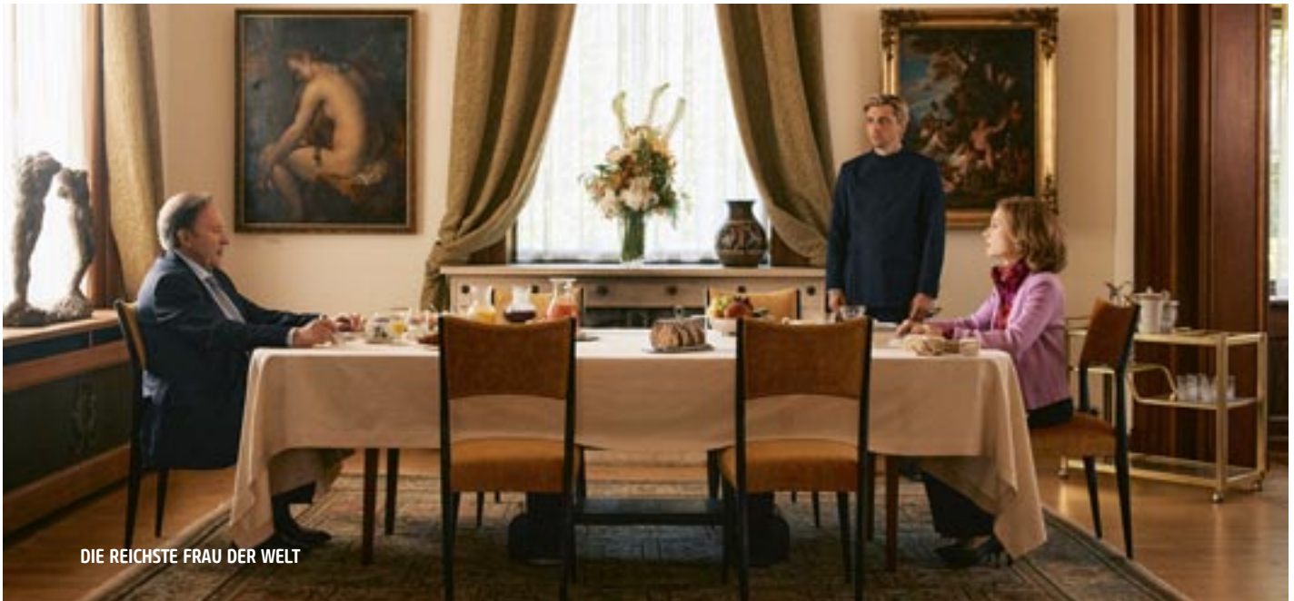
DIE REICHSTE FRAU DER WELT